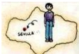
Ahora (actualmente) vivo en Sevilla.