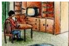
Ahora vivo solo.