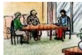
Antes he vivido con mis padres.