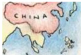
Antes he vivido en China.