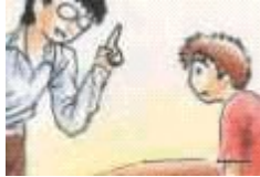
El profesor habla y el alumno se calla.