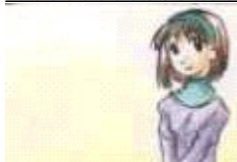
Ella es (nombre)