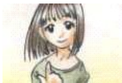
Tú eres (nombre)