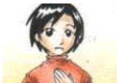
Yo soy (nombre)