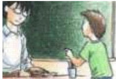
Un alumno pide un diccionario al profesor.