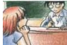
Elena mira al profesor