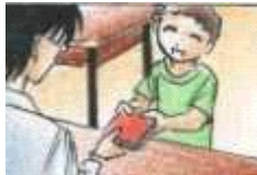
El profesor deja el diccionario al alumno