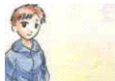
Él es (nombre)