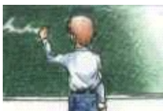
El maestro escribe en la pizarra.