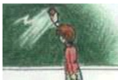
El alumno borra la pizarra.