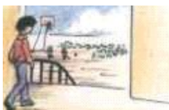
El niño va al patio.