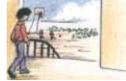
Ir al patio _____