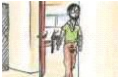
El maestro sale de la clase.