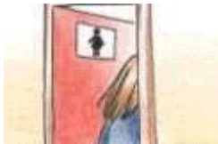
Ir al Servicio _____