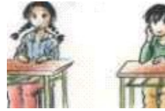
El niño y la niña están en la clase.