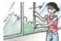
La maestra abre la ventana.