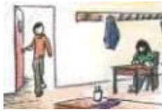
El alumno entra en la clase.