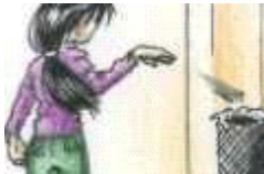
La niña tira un papel en la papelera.