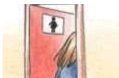
La niña va al servicio.