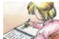
La alumna escribe en la libreta.